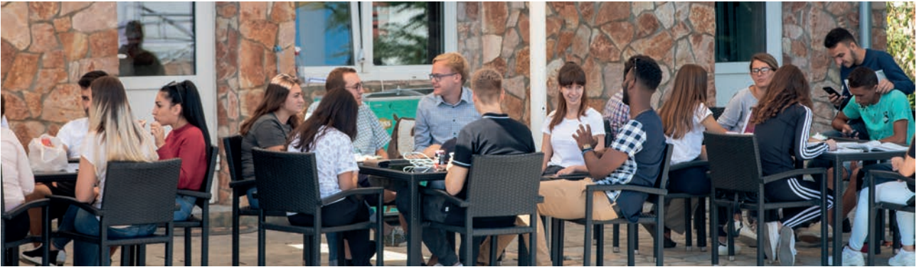
Cafe L'Aurore, ein beliebter Treffpunkt für junge Leute.