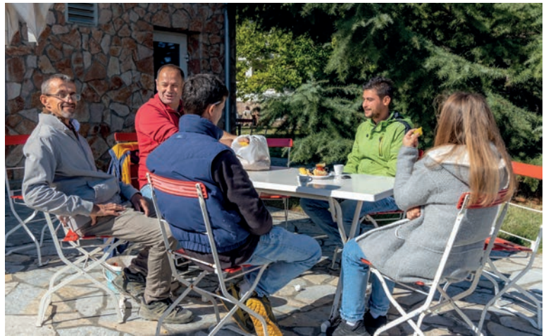
Kollegen aus verschiedenen Arbeitsbereichen treffen sich im Café L'Aurore