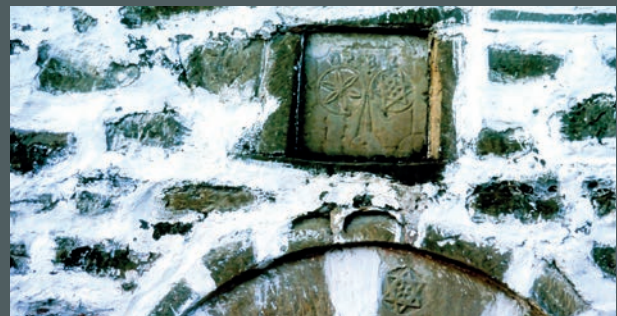
Davidsterne an einer Eingangstür in Karçë in den 80-er Jahren.

Nach der Besetzung Albaniens durch Deutschland im Jahr 1943 weigerte sich die albanische Bevölkerung in einem außergewöhnlichen Akt, den Besatzern Listen mit den Namen der unter ihr lebenden Juden auszuhändigen. Außerdem versorgten verschiedene staatliche Einrichtungen jüdische Familien mit gefälschten Papieren, damit sie sich unter die einheimische Bevölkerung mischen konnten. Die Albaner schützten nicht nur ihre eigenen jüdischen Mitbürger, sondern gewährten auch denjenigen Zuflucht, die nach Albanien gekommen waren, als es noch unter italienischer Herrschaft stand und die nun in ständiger Gefahr lebten, in Konzentrationslager deportiert zu werden.