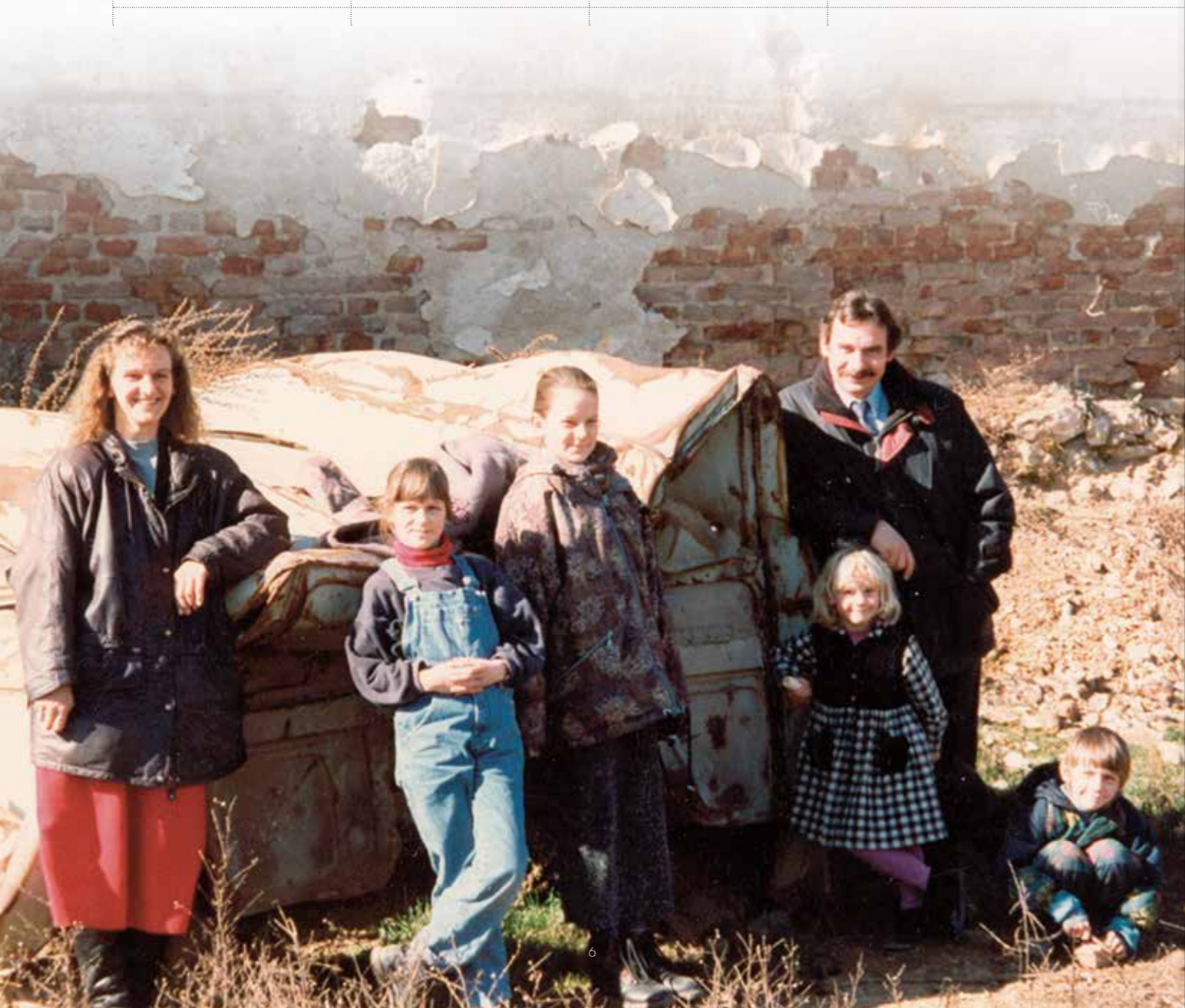
Familie Geiger in Albanien

Gründung der Nehemiah Gateway gGmbH mit Headquarter in Nürnberg