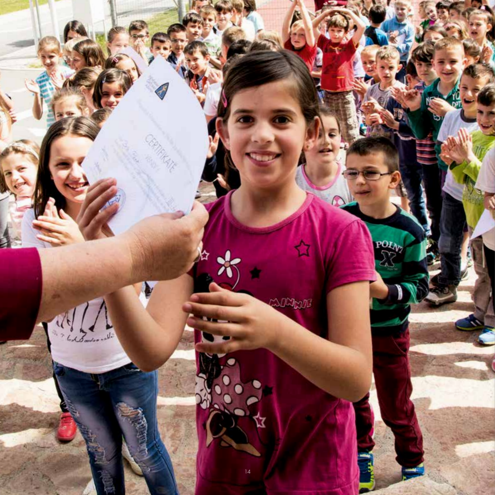
Mit Begeisterung lernen – Urkundenvergabe an der Nehemia Schule in Albanien