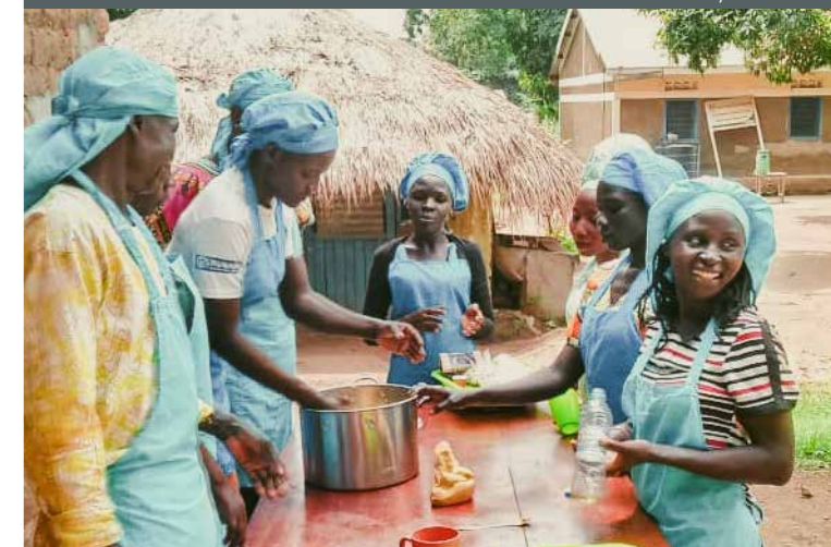
Kochkurse in Yei/Südsudan

NG unterstützt den Wiederaufbau zerstörter Schulgebäude und eine Anzahl von Berufsbildungskursen vor allem für Frauen und Mädchen.